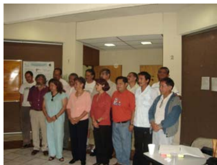
Nueva mesa directiva 2006-2008.