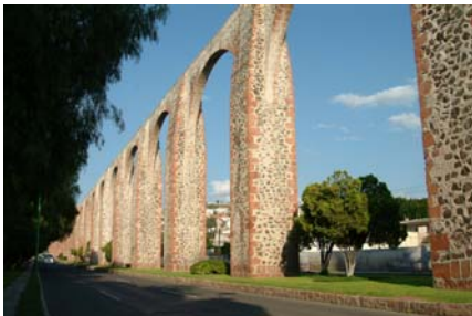
Panorámica de la calzada de los Arcos en Querétaro, Qro.