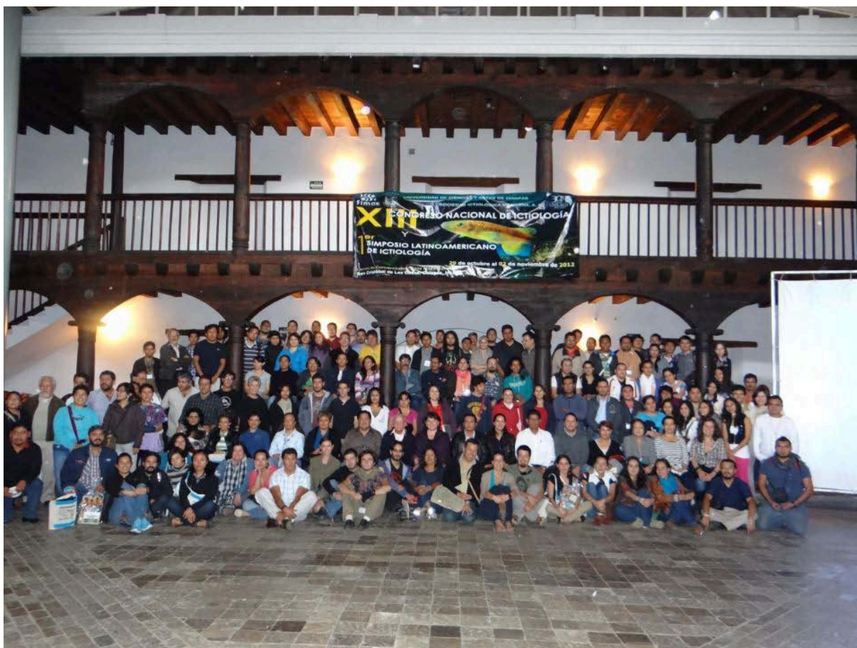
Foto oficial XIII Congreso Nacional de Ictiología y I Simposio Latinoamericano de Ictiología San Cristóbal de las Casas, Chiapas, México, 2 de noviembre de 2012

Para promover, difundir e impulsar el conocimiento de la Ictiología, así como la protección y el uso racional de los recursos ícticos de México.